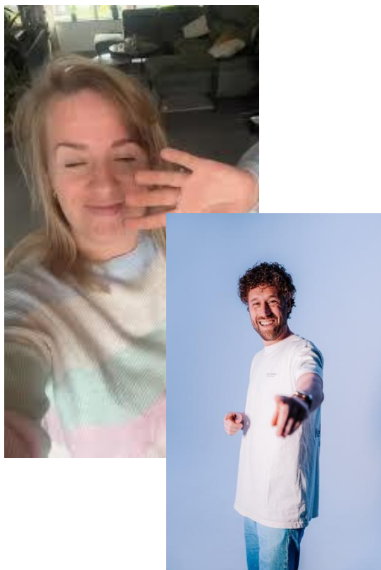
Wat brengen zij over?