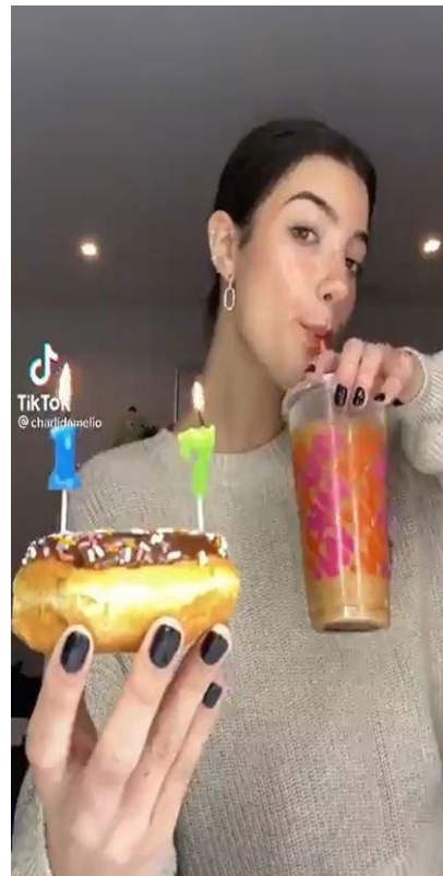
Is dit gezond?