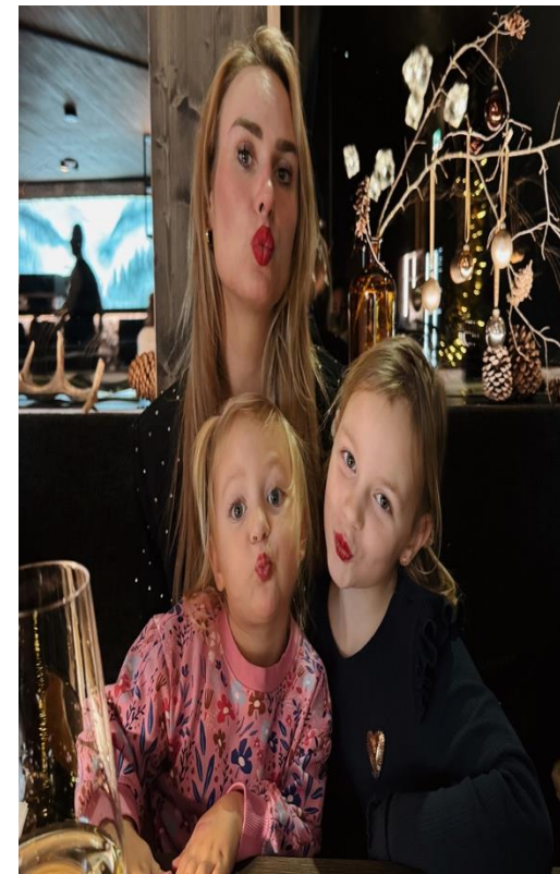
Hoe verdienen ze hun geld?